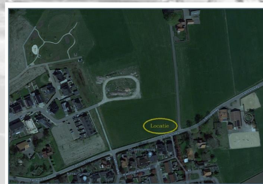
Fig. 2 - Locatie van de historische boerderijsporen (Google maps)