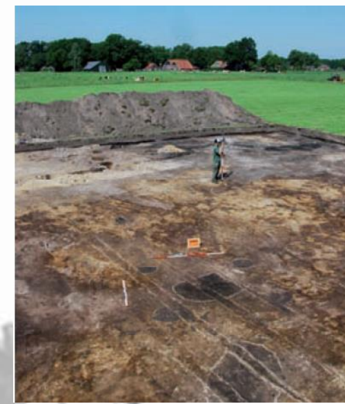
Locatie spikkert 3/4